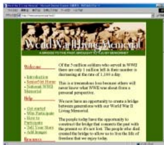
図表2. 「シニアネット『第二次世界大戦の記憶』」のページ

例えば、このコミュニティには第二次世界大戦の実体験を若い世代に伝達するコーナーがある(図表2)。このコーナーのきっかけは、ある中学校の先生から「授業で歴史の教育をやりたいたいけれども、話をしてくれる年長者はいませんか」と